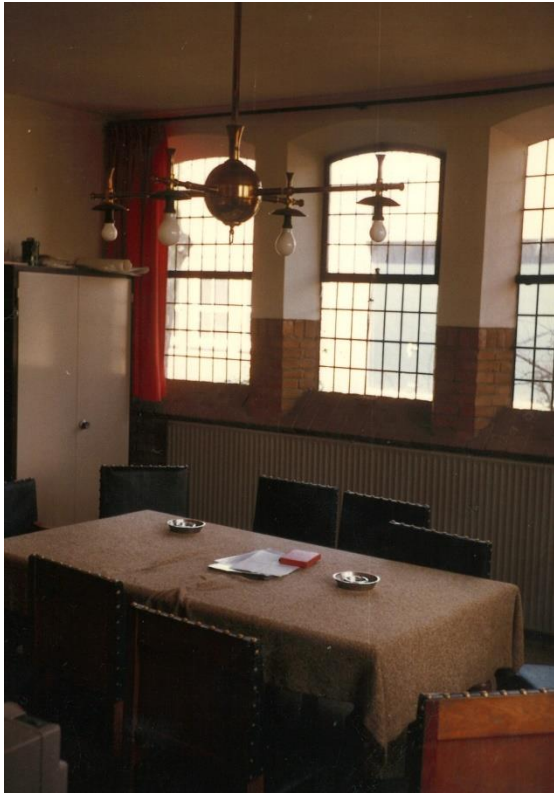
een consistorie elders